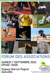
FORUM DES ASSOCIATIONS SAMEDI 7 SEPTEMBRE 2024 09h00 - 13h00 Espace Marcel Pagnol GUILERS