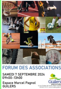
FORUM DES ASSOCIATIONS SAMEDI 7 SEPTEMBRE 2024 09h00-13h00 Espace Marcel Pagnol GUILERS