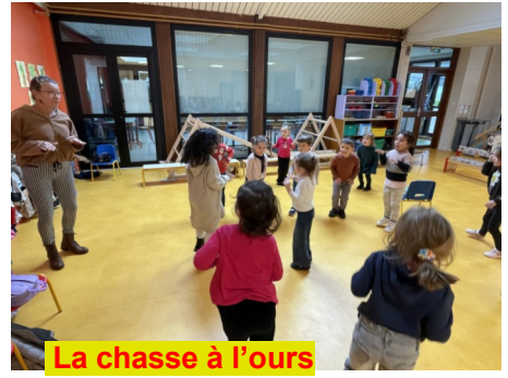
La chasse à l'ours