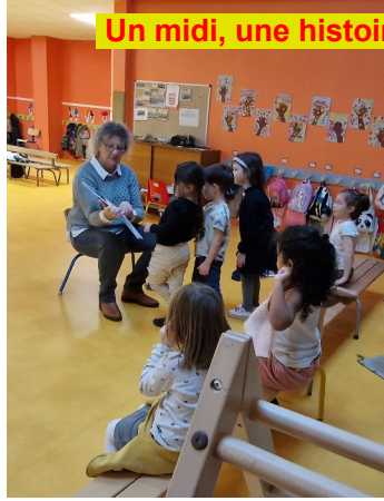
Un midi, une histoire