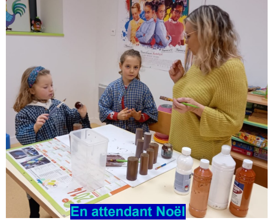
En attendant Noël!