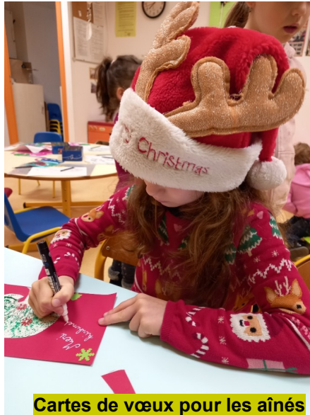
Cartes de vœux pour les aînés