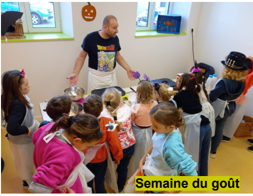
Semaine du goût