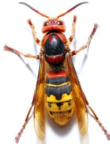
Frelon commun (jusqu'à 4 cm)