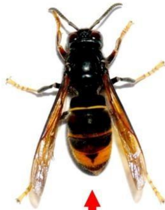
Frelon asiatique (taille réelle 3 cm)