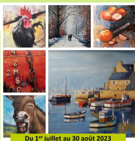
Du 1 er juillet au 30 août 2023