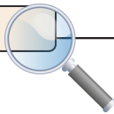
Schéma Régional d'Aménagement et de Développement Durable du Territoire (SRADDET) :

Le Conseil régional, lors de sa session du 28 novembre 2019, a arrêté son projet de Schéma Régional d'Aménagement et de Développement Durable et d'Égalités des Territoires. Afin de permettre au public d'en prendre connaissance et de s'exprimer sur le projet, une enquête publique aura lieu (en ligne via bretagne.bzh/enquetepublique-sraddet/ ) du mardi 18 août au vendredi 18 septembre .