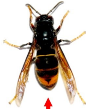
Frelon asiatique (taille réelle 3 cm)

Contrairement au nid définitif, les nids primaires peuvent être détruits par écrasement en fin de journée pour être sûr que la reine y soit rentrée. La destruction des nids secondaires (beaucoup plus gros et difficiles d'accès) présente un risque et sa destruction doit être exécutée par un professionnel. Pour tous renseignements et signalements, merci de contacter la mairie au 02 98 37 37 37.