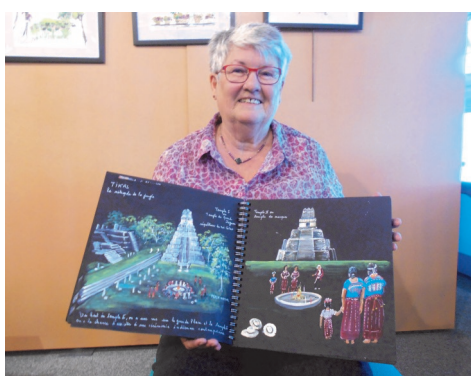
Gratuit - Tout public - A la Guilthèque.

Visionnage de photos, discussion et présentation de son carnet de voyage primé.