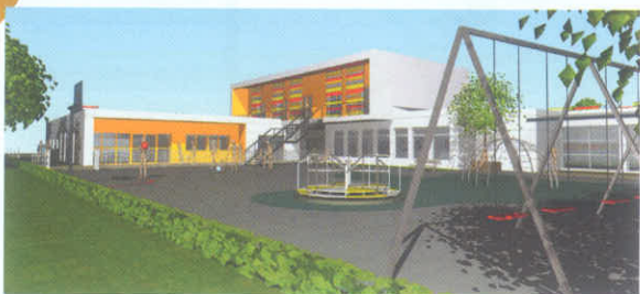
Maison de l'enfance

Parallèlement, nous sommes très vigilants sur l'évolution de notre budget de fonctionnement malgré la hausse importante des dépenses de combustible. En conclusion, cet exercice 2012 nous permettra de poursuivre tous les investissements programmés et d'entretenir notre patrimoine communal. Il nous permettra également de poursuivre l'aide que nous apportons à nos associations ainsi que celle en faveur des particuliers dans le cadre du développement durable.