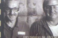
Des histoires de...Arsenal

Si vous êtes intéressé(e)s, vous pouvez téléphoner au 02 98 07 61 52 ou envoyer un message à l'adresse suivante: erwan.cras@mairie-guilers.fr avant le vendredi 23 juin. Les places au sein du Collectif Artistique seront limitées mais renouvelées périodiquement.