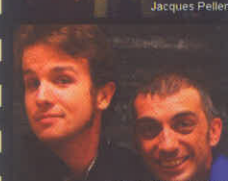
Compagnie Impro Infini