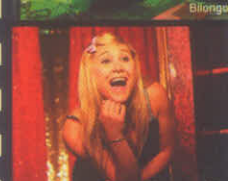
Beregere Krief