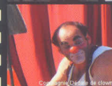
Compagnie Dada de clown