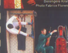
Circo de Aondo