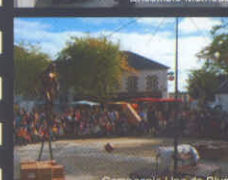
Compagnie Une de Plus