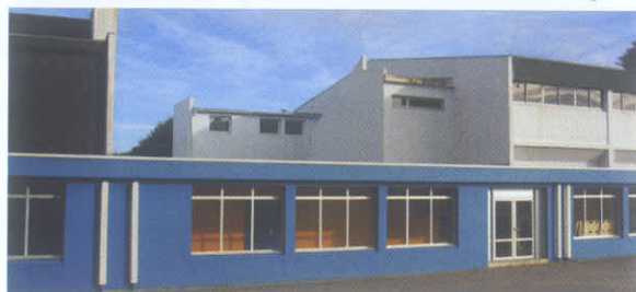
Fort de Penfeld