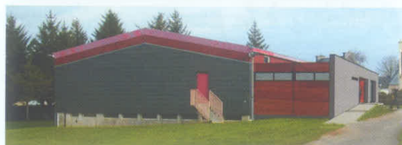
Salle de judo