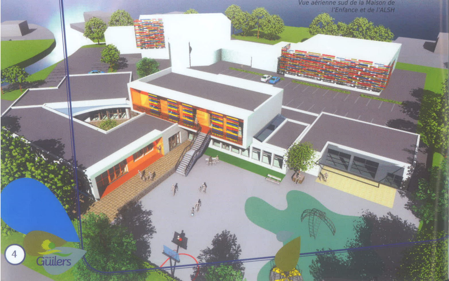
Vue aérienne sud de la Maison de l'Enfance et de l'ALSH