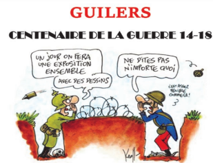
A l'occasion de la sortie du livre, Guilers au début du XX e siècle . L'association RACINES et PATRIMOINE vous invite à commémorer le centenaire de cette guerre en participant à un

Au programme : Café-Concert, chants d'époque par la chorale Arpège accompagnée des accordéonistes d'Aveldorn, lectures de textes... Entrée libre. Venez nombreux !