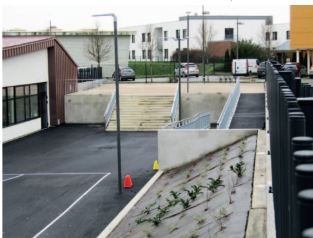
Entrée par la rue Jean Rostand