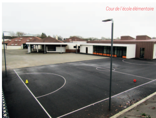
Cour de l'école élémentaire

Les enfants de l'élémentaire entrent désormais par la rue Jean Rostand (côté EHPAD).