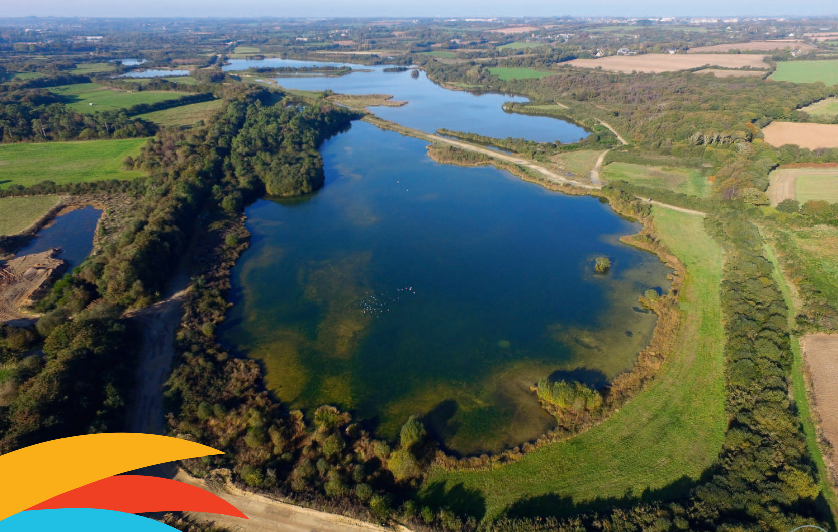
Les sablières de Bodonou