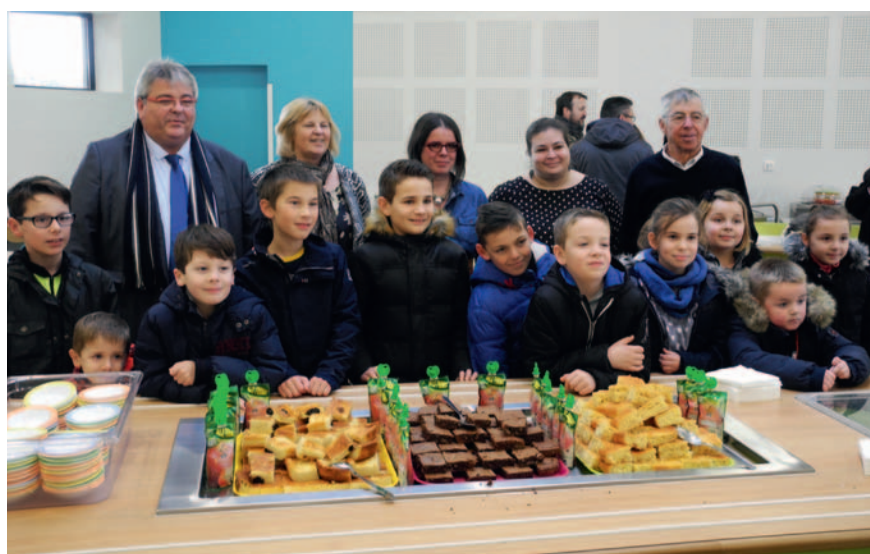
gâteaux réalisés par l'équipe de la cuisine centrale, que chacun a pu échanger.

Personnels et élus, mais aussi les enfants, ont ainsi pu expliquer le fonctionnement de ce nouvel espace aux personnes présentes puis c'est autour d'une boisson chaude et en dégustant les