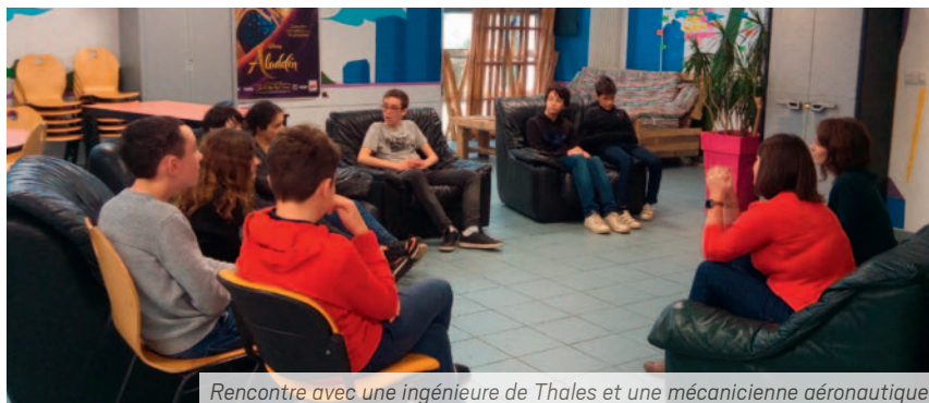
Rencontre avec une ingénieure de Thales et une mécanicienne aéronautique