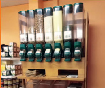
L'épicerie sociale se met au vrac page 4