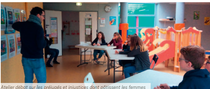
Atelier débat sur les préjugés et injustices dont pâtissent les femmes