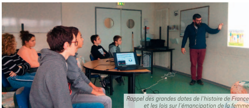
Rappel des grandes dates de l'histoire de France et les lois sur l'émancipation de la femme