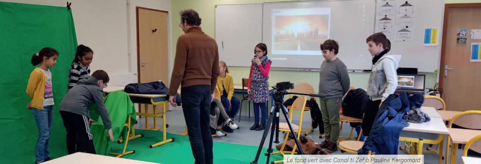
Le fond vert avec Canal ti Zef à Pauline Kergomard