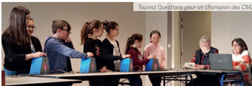
Tournoi Questions pour un champion des CM2