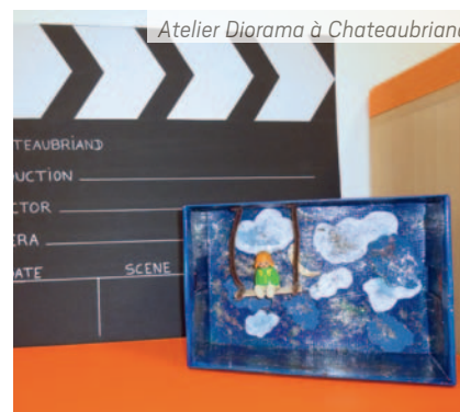
Atelier Diorama à Chateaubriand

fabriqué leur propre diorama, système de présentation par mise en situation d'un modèle dans son environnement habituel en 2D.