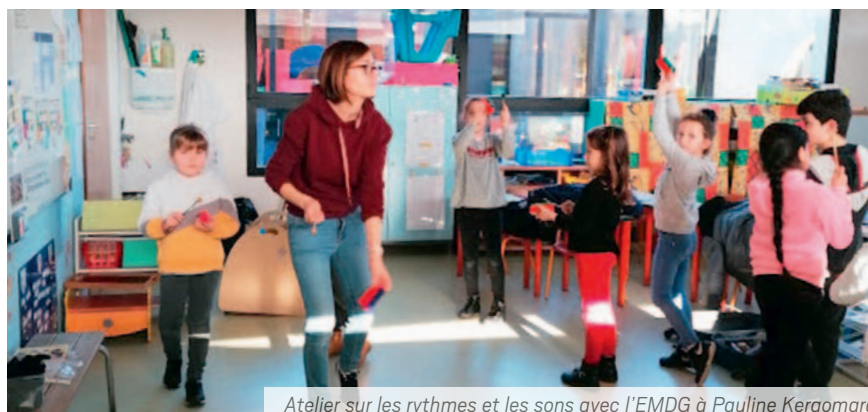
Atelier sur les rythmes et les sons avec l'EMDG à Pauline Kergomard

Les enfants ont créé leur propre flip book, carnet d'images assemblées à feuilletter rapidement pour donner une impression de mouvement et créer une séquence animée sans l'aide d'une machine. Ils ont également fabriqué leur "roue à miracles" : un thaumatrope. Considéré comme l'un des ancêtres du cinéma, c'est un disque ayant un dessin différent sur chaque face qui, tourné rapidement sur lui-même, crée une illusion de mouvement par superpositions d'images.