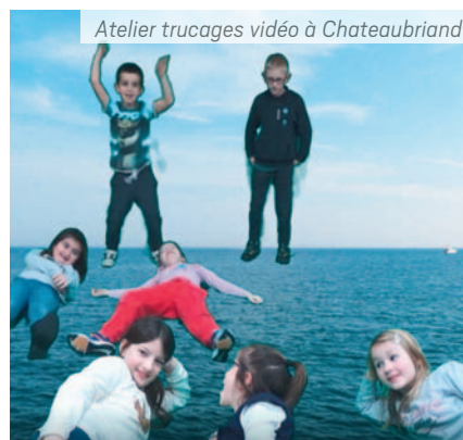
Atelier trucages vidéo à Chateaubriand