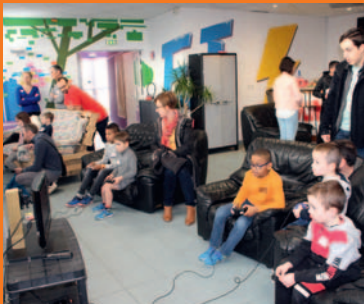
Guilers entre en jeux page 6