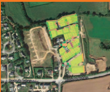
Le Vallon de Guilers, nouveau lotissement page 10