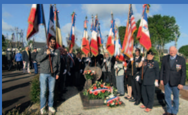
Retour sur l'inauguration des rues Général Leclerc et Louis Tréguer page 4