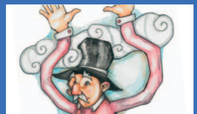
2 ème édition du festival "les mains en l'air" page 10