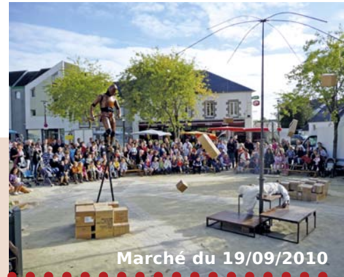
Marché du 19/09/2010

En conclusion, le mouvement amorcé doit s'amplifier afin de créer une véritable DYNAMIQUE pour l'avenir.