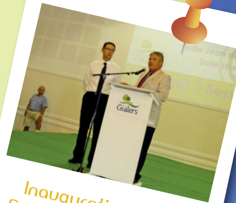
Inauguration de la Salle Jean de Florette