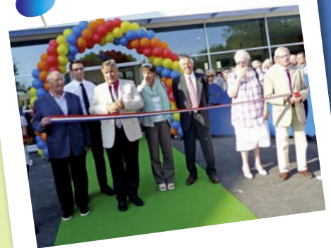
Coupe du ruban