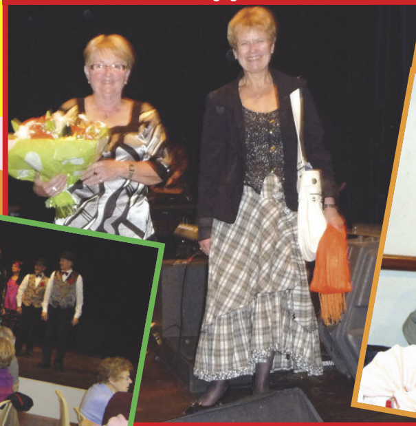
« les Doyens du repas 2009 »