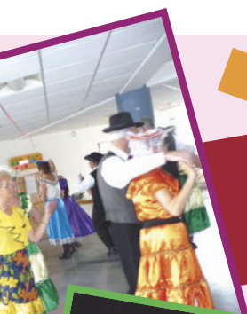
« Tréteaux Chantants, la gagnante 2009 et 2008 ».