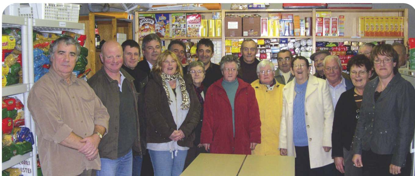
« Bénévoles et élus de la banque alimentaire ».

En 2009, les bénévoles du CCAS et les associations partenaires ont également organisé la journée du refus de la misère en octobre et participé au Téléthon en décembre.