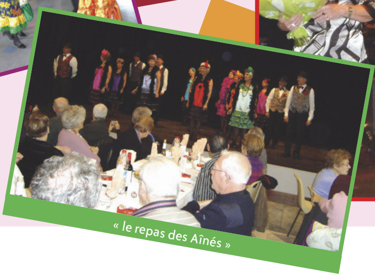
« le repas des Aînés »