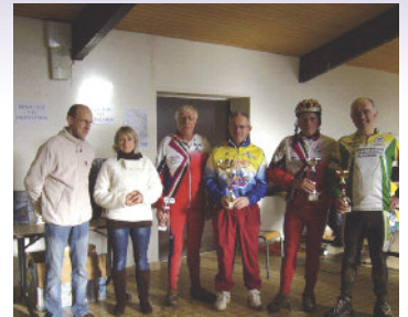
Remise de récompenses aux clubs les plus représentés : Milizac Vtt Loisirs - Entente Cycliste Renanaise - AS Plouguin

254 participants ont eu le choix entre des circuits de 22, 32 & 40 kms avec sur le 40 kms un passage inédit . La plus longue boucle allait jusqu'à Brélès & Plourin. Les vététistes pouvaient aussi participer à une épreuve d'orientation qui les menait jusqu'à la vallée de Saint-Anne à Brest et ils devaient découvrir 15 balises répartis sur le secteur géographique de Guilers, Brest, Plouzané.