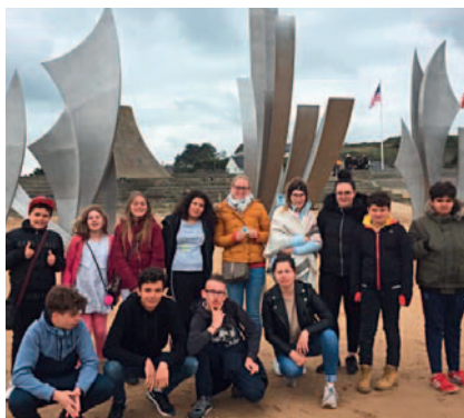
Sur la plage d'Omaha Beach