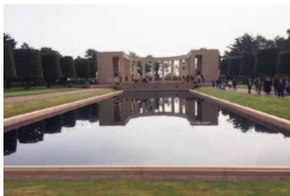
Au cimetière Américain de Colleville