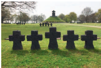
Au cimetière allemand de La Cambe