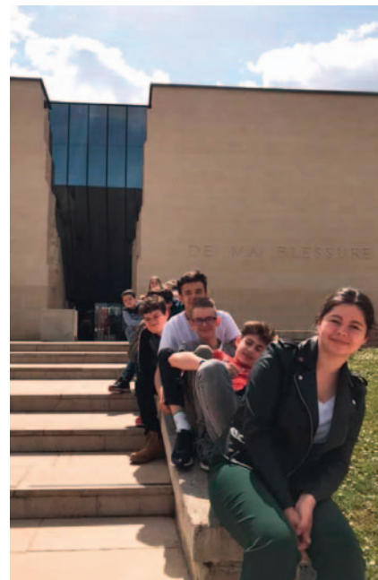
Devant le mémorial de Caen