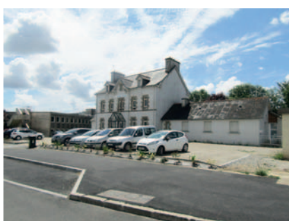
Nouveau parking Maison Saint-Albert