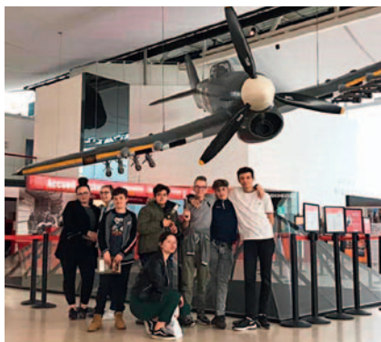
Au mémorial de Caen