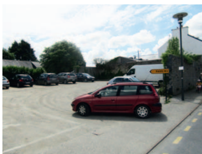
Nouveau parking temporaire en face du Fromentier