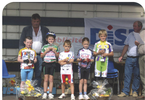
Remise de coupes aux jeunes cyclistes