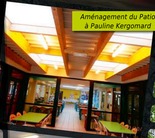
Aménagement du Patio à Pauline Kergomard