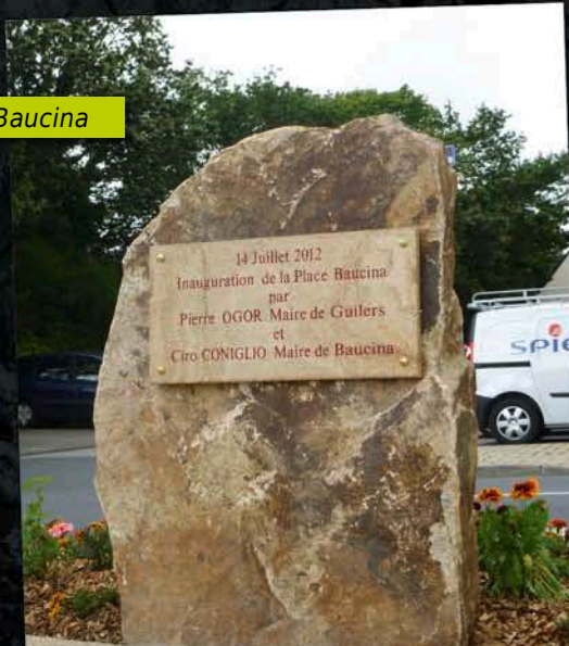
Stèle de la Place Baucina