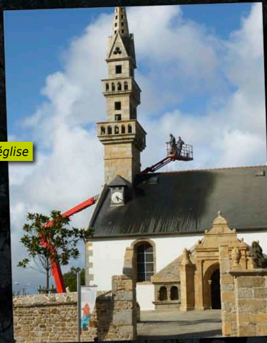
Ravalement de l'église