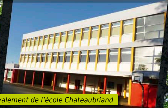
Ravalement de l'école Chateaubriand