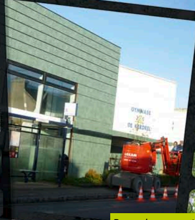
Remplacement du bardage du gymnase Kerdrel