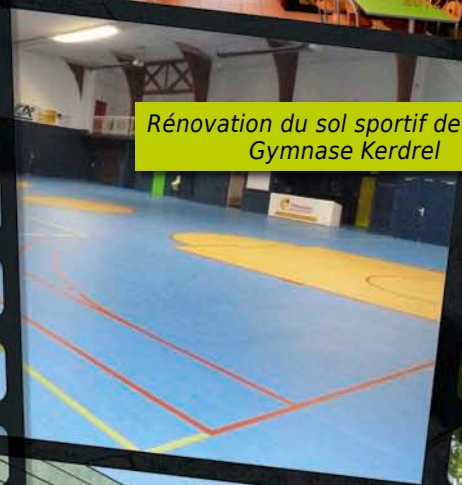
Rénovation du sol sportif de basket Gymnase Kerdrel