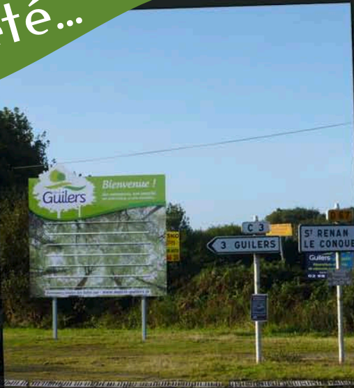
2 ème panneau d'entrée de ville intersection axe Gouesnou-St Renan