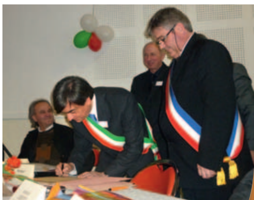
Signature du serment de fraternité.