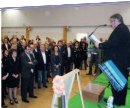
Cérémonie des vœux 2012