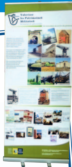
Participation de l'Espace Jeunes

Les visiteurs ont également pu découvrir les installations sportives : le terrain de football nouvellement réengazonné, la piste d'athlétisme, le gymnase, la salle de musculation, etc. Ces installations seront utilisées rapidement et afin d'apporter des améliorations relatives aux trajets et accès de ce site par les futurs utilisateurs, des aménagements sont en cours de gestion.