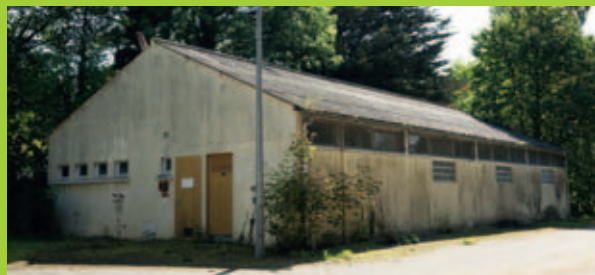
La salle de musculation avec vestiaires et sanitaires

Les nouveaux équipements sportifs de Penfeld