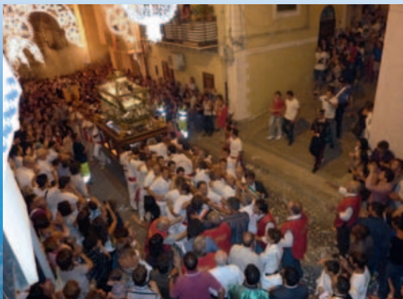
Procession dans les rues de Baucina de la Santa Fortunata