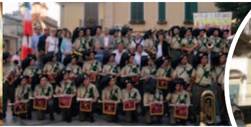
Fanfare de Palerme