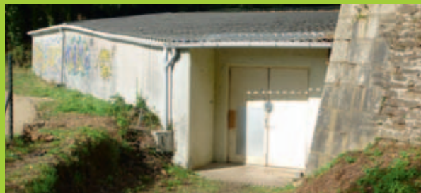
Le stand de tir et son club house