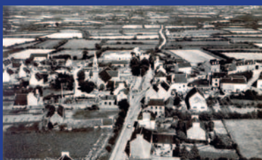
Construire le Guilers de demain page 4-5