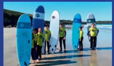
L'été à l'espace jeunes page 9