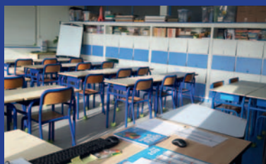
Tarifs et horaires des écoles et des services périscolaires page 6